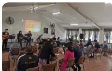
M1 國際宣道會 (昆州)