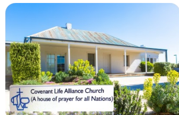
Covenant Life 宣道會 (首都領地)