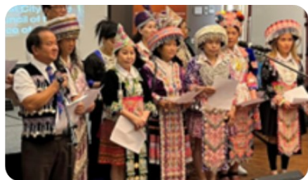
墨爾本苗族宣道會 (維州)