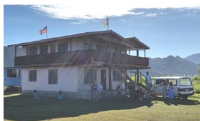
斐濟 - 宣道會教堂