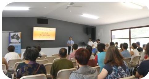
黃金海岸宣道會 (昆州)