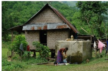
越南 - 布魯雲喬族