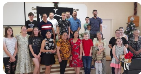
Whyalla 宣道會 (南澳)