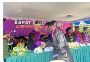
巴布亞 - 神學院學生